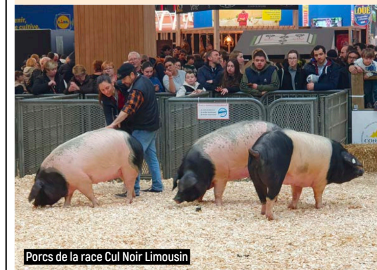
Porcs de la race Cul Noir Limousin