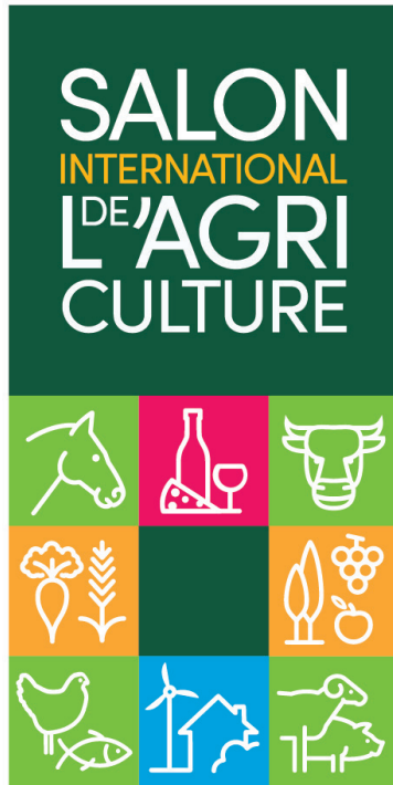
Version carrée à utiliser pour le web uniquement